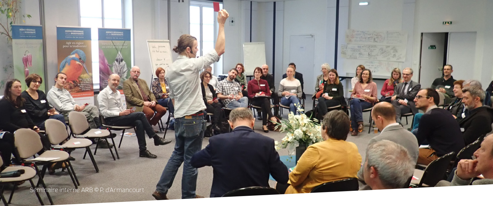
Séminaire interne ARB