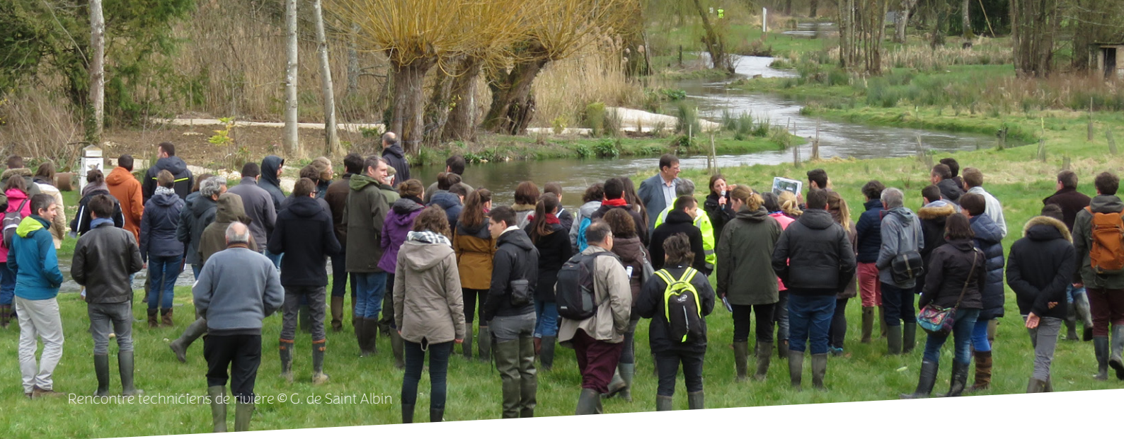
Rencontre techniciens de rivière