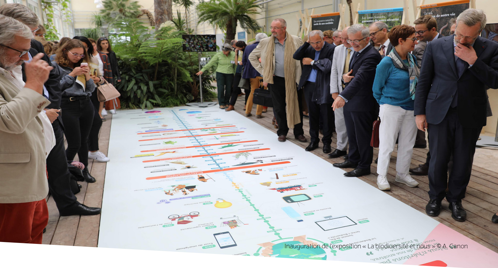
Inauguration de l'exposition « La biodiversité et nous »